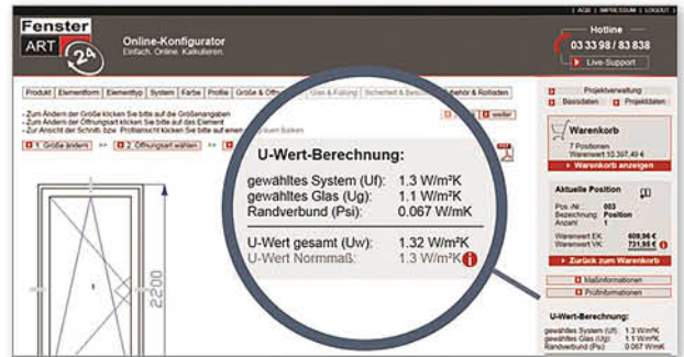
Während der Konfiguration wird der U-Wert eines Elements angezeigt und bei Änderungen automatisch angepasst.

Maßgefertigte Fenster und Türen zu konfigurieren ist eine anspruchsvolle Aufgabe für Handwerksbetriebe. Die Wisser GmbH aus Büdelsdorf bei Kiel profitiert vom Online-Konfigurator FensterART24. Mit der webbasierten Software wurden sämtliche Arbeitsabläufe in einem System integriert und die Kunden der Tischlerei freuen sich über anschaulichere und detailliertere Angebote.