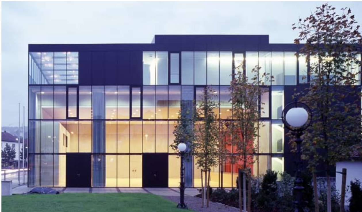
← Kulturzentrum, Uhingen Ausführung: SOLARLUX® polaris // Foto: © Arnold Glas